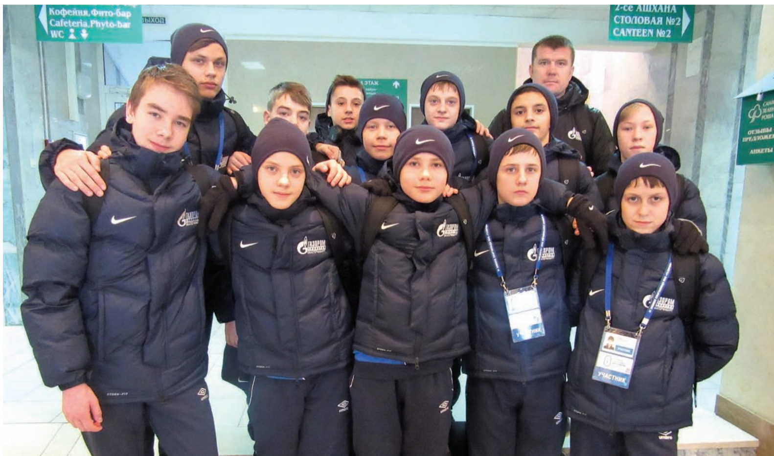
Спартакиада нас сплотила

Санаторий «Зеленая Роща» на эти дни стал детской резиденцией XI зимней Спартакиады «Газпрома». Юные спортсмены съехались из разных городов России.