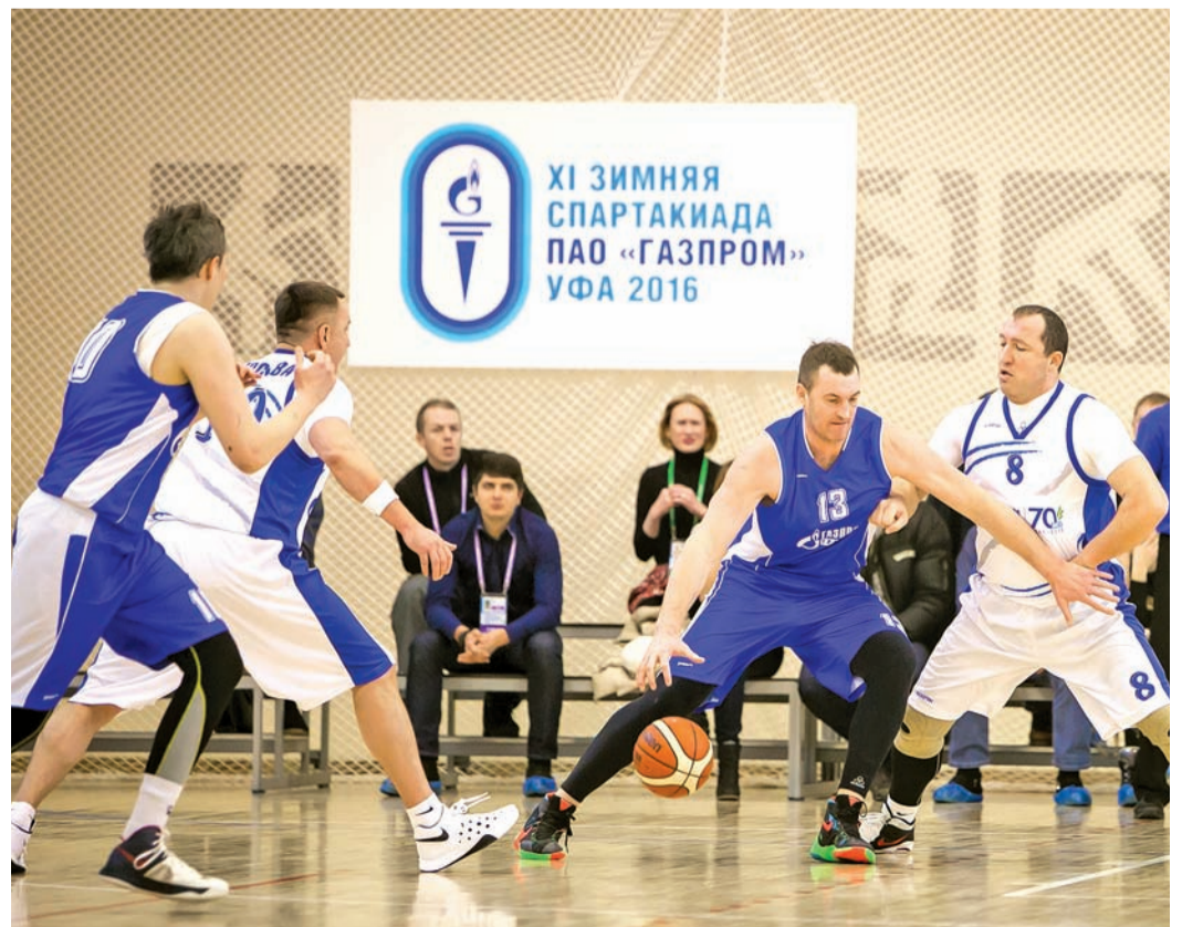
■ Борьба за мяч