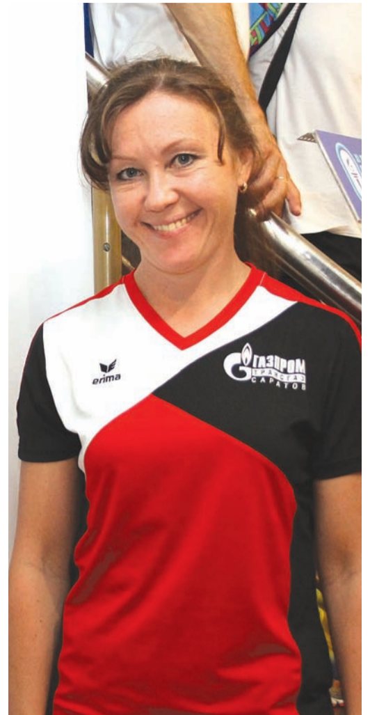
С улыбкой по жизни

Беседовал Владимир ПОСПЕЛОВ.