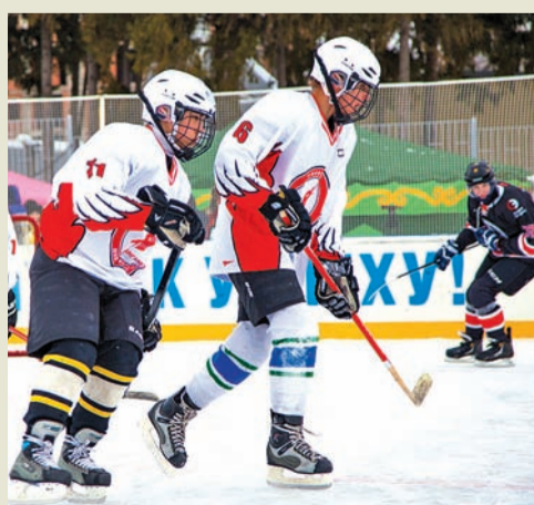
Школьники учились у кумиров

В перерывах между товарищескими матчами команд «Российская пресса», «КомАр» и ООО «Газпром трансгаз Уфа» прошел мастер-класс для детей Демской коррекционной школы.