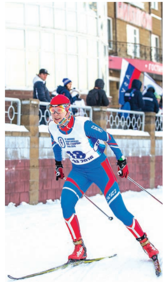
■ Последние метры