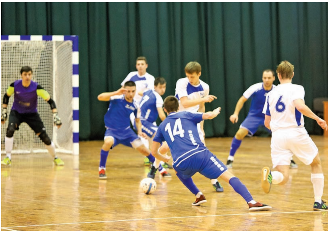
Опасный момент у ворот

Последний день группового турнира по мини-футболу среди взрослых получился нервным и крайне эмоциональным. Никто не хотел уступать, стараясь вырвать победу.