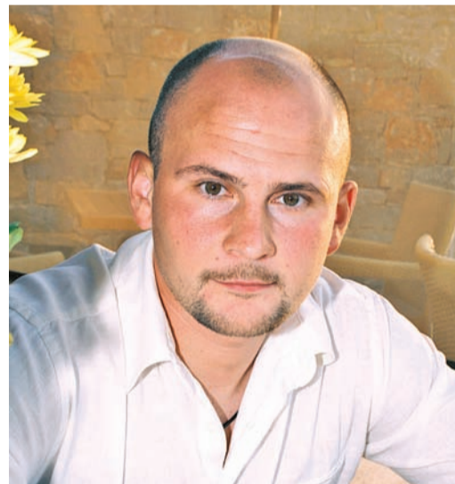
Из футбола не ушел