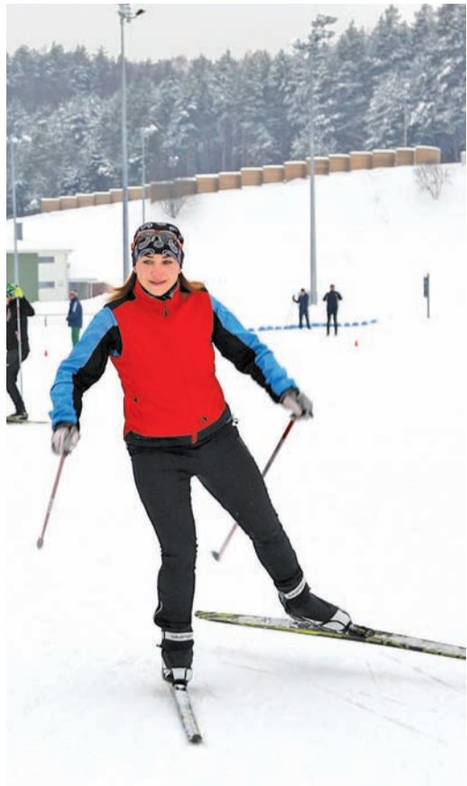
Лыжи заряжают энергией

Для команды белорусских лыжников подготовка к Спартакиаде в Уфе была не самой простой. Причиной этому стала капризная и непривычно теплая зима в Беларуси. Семь градусов выше нуля, легкий дождь – таким выдался декабрь. Только в канун Нового года на территории страны установилась по-настоящему снежная и морозная погода.