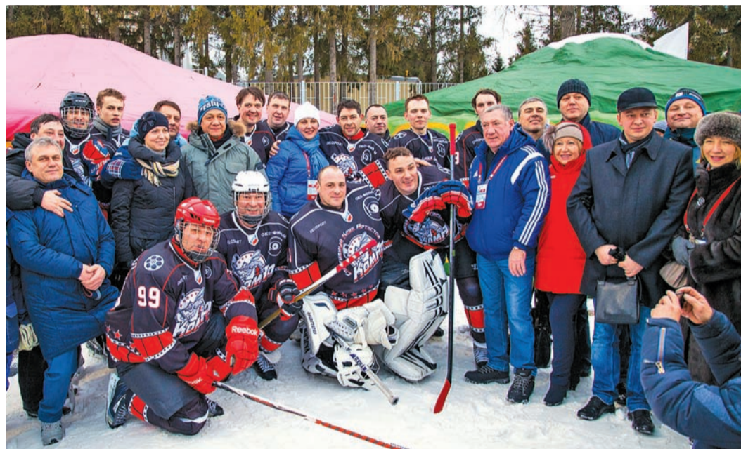
Игра получилась азартной

А также журналисты и спортивные комментаторы. Посмотреть на звезд театра и кино, телеведущих федеральных каналов с хоккейными клюшками можно было на серии товарищеских матчей на открытом стадионе Административно-управленческого комплекса «Газпром трансгаз Уфа».